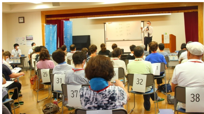
仕事相談会・面接会の様子